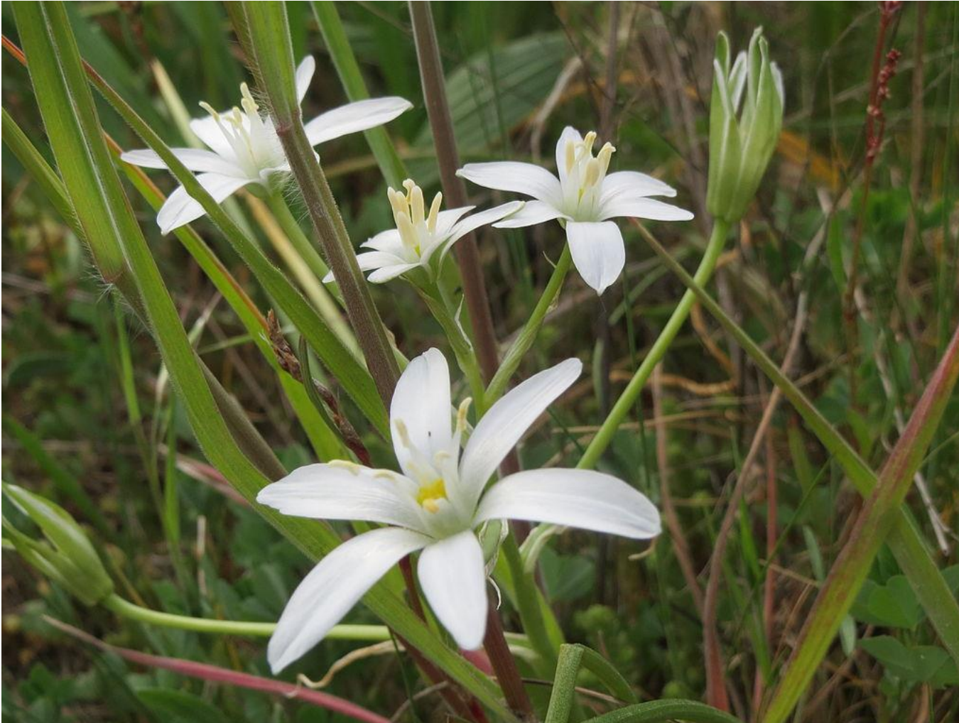
Dolden-Milchstern ( Ornithogalum umbellatum )